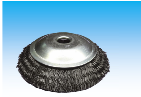
名称：ペペル型イブシ 125-16 0.3 価格：600 円 コード：C3-015