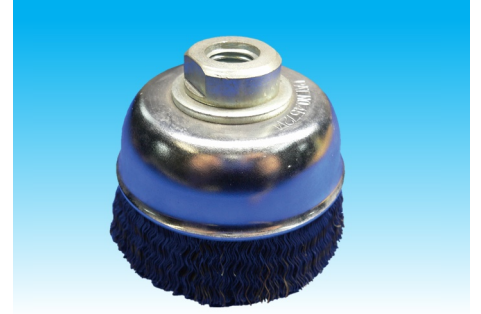
名称：カップ型SUSブシ 90-M16 0.3 価格：1600 円 コード：C2-011