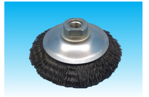
名称：ペペル型イブシ 125-M16 0.3 価格：800 円 コード：C3-003