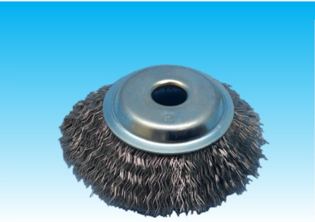
名称：ペペル型SUSブシ 100-16 0.3 価格：700 円 コード：C3-018