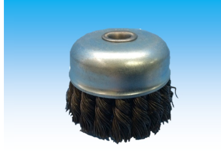
名称：紗リ式カップ型イブシ 60-M10 0.5 価格：1100 円 コード：C2T-001