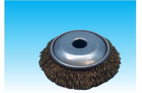
名称：ペペル線イブシ 100-16 0.3 価格：300 円 コード：31110004